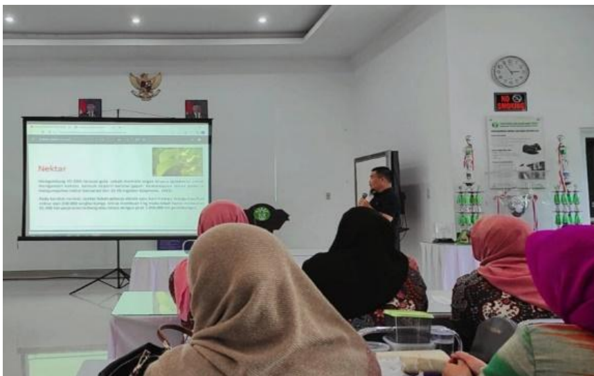
Gambar 2. Pemaparan Materi Kepada Peserta (Harmain, 2022)

Pada sesi ini peserta dapat melihat langsung kantong-kantong madu di kotak lebah yang telah disediakan untuk pelatihan. Bahkan sebagian peserta berkesempatan untuk mencicipi madu secara langsung dari kantong - kantong madu yang ada. Antusias peserta di sesi ini sangat terlihat dengan banyaknya pertanyaan yang diajukan dan diskusi.