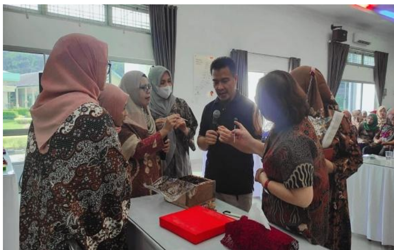
Gambar 3. Teknik Pemanenan Madu dan Polen (Harmain, 2022)

Selanjutnya peserta diperlihatkan kantong - kantong yang berisi polen. Pengambilan polen cukup dengan mengangkat kantong - kantongnya. Lalu polen dikeluarkan dari kantongnya dan disimpan dalam wadah tertutup dan dimasukkan dalam lemari pendingin. Untuk tujuan komersial pengolahan polen lebih lanjut dikeringkan dalam oven. Setelah benar - benar kering lalu dikemas dalam botol. Pada kesempatan ini diserahkan pula koloni lebah tanpa sengat sebagai bahan praktek dari kegiatan yang dilakukan.