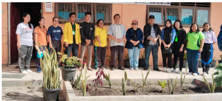
Gambar 4: Kegiatan Pemberdayaan Masyarakat

Pembersihan Bibir Pantai Pada Tahap Pelaksanaan Kegiatan Di Lapangan