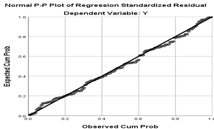
Gambar 2: Uji Normalitas

normal dapat dilihat titik-titik menyebar di sekitar garis serta penyebarannya mendekati dan mengikuti arah garis diagonal. Grafik ini menunjukkan bahwa model regresi memenuhi asumsi normalitas.