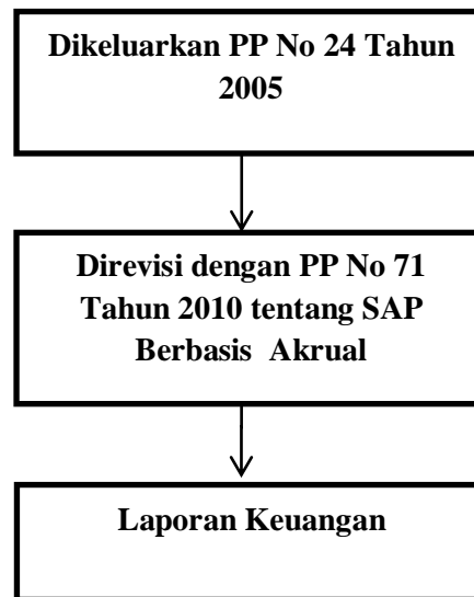
Gambar 1 Kerangka Pemikiran