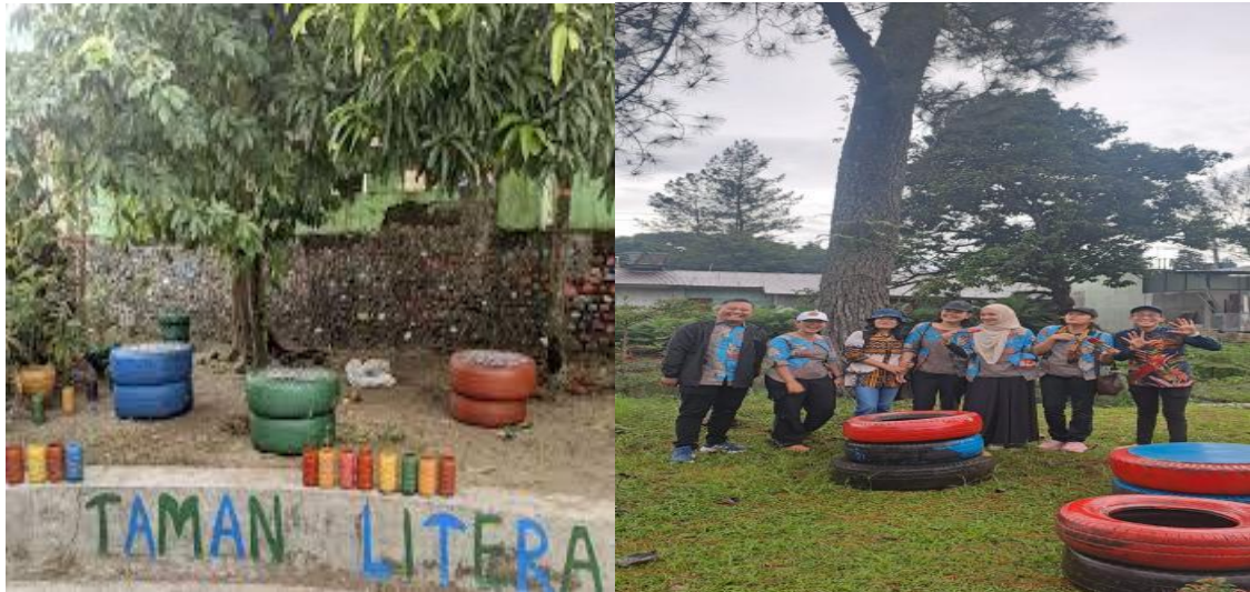
Gambar 3: Hasil Taman Literasi Dari Ban Bekas

Secara umum, metode yang digunakan mengacu pada kegiatan pengabdian yang menekankan keterlibatan langsung peserta dalam proses belajar dan pemanfaatan lingkungan sekitar sebagai sumber belajar. Pendekatan ini dinilai efektif dalam meningkatkan pemahaman dan keterampilan secara praktis (Leria et al., 2020; Lusiana et al., 2023)