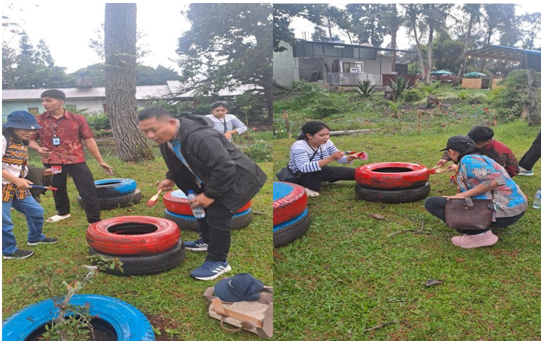
Gambar 2: Pembuatan Taman

Tahap keempat adalah evaluasi kegiatan. Evaluasi dilakukan melalui observasi terhadap perubahan aktivitas membaca serta keterlibatan peserta selama kegiatan berlangsung. Selain itu, digunakan angket sederhana untuk melihat perubahan minat baca sebelum dan sesudah kegiatan.