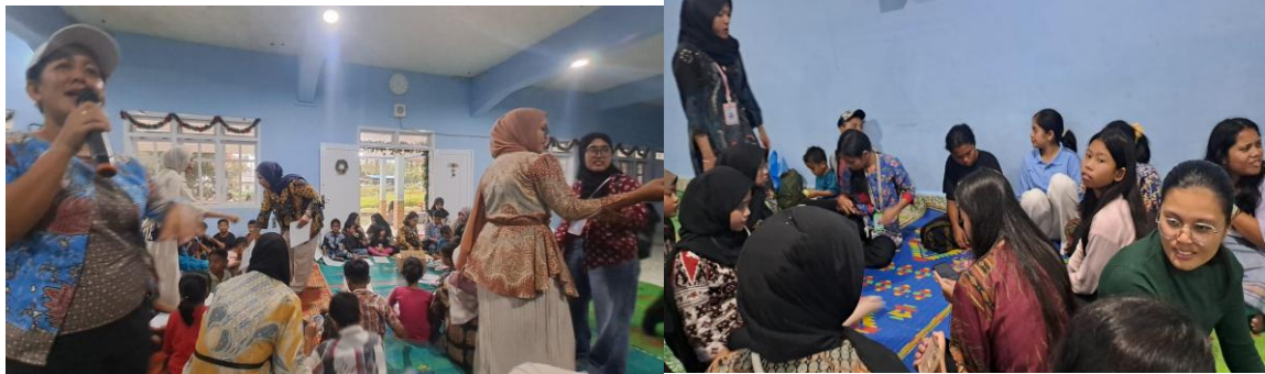
Gambar 1: Sosialisasi

Tahap ketiga adalah pelatihan dan praktik pembuatan taman literasi. Pada tahap ini, peserta dilibatkan dalam proses pembersihan ban bekas, pengecatan, serta penyusunan menjadi kursi, meja, dan rak buku. Kegiatan dilanjutkan dengan penataan area taman agar dapat digunakan sebagai ruang membaca yang nyaman.