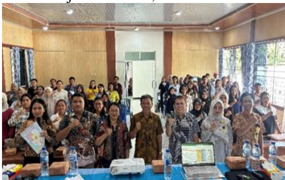
Gambar 2: Foto bersama Narasumber, Tim DPMN Kabupaten Simalungun dan Camat Tanah

Kegiatan pendampingan penyusunan laporan keuangan BUMNagori melalui aplikasi PPAK BUMDes di Kantor Camat Tanah Jawa dilaksanakan sebagai upaya meningkatkan kapasitas peserta dalam memahami, mencatat, mengelola, dan melaporkan transaksi keuangan secara lebih tertib. Kegiatan ini diikuti oleh 51 orang bendahara dan pengelola BUMNagori dari Kecamatan Tanah Jawa, Huta Bayu Raja, Jawa Maraja Bah Jambi, dan Hatonduhan.