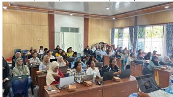
Gambar 3: Peserta sedang Pelatihan

Pelaksanaan kegiatan difokuskan pada penguatan pemahaman akuntansi dasar dan praktik pencatatan berbasis aplikasi. Materi yang diberikan meliputi laporan keuangan dan kebijakan akuntansi, persamaan dasar akuntansi, pengenalan akun-akun akuntansi, teknik analisis transaksi, pengenalan aplikasi PPAK BUMDes, simulasi jurnal umum ke aplikasi, praktik penyusunan jurnal umum dari Buku Kas Umum, SOP pengadaan barang/jasa BUMNagori, teknik pengarsipan bukti transaksi, landasan hukum musyawarah nagori laporan tahunan BUMNagori, serta kebijakan pembagian laba usaha atau kerugian usaha BUMNagori. Materi tersebut relevan dengan kebutuhan tata kelola keuangan BUMNagori karena pengelolaan keuangan yang baik membutuhkan kemampuan mencatat, mengklasifikasi, menyajikan, dan mempertanggungjawabkan transaksi secara tertib (Nordriawan & Hertianti, 2018; Mardiasmo, 2021).