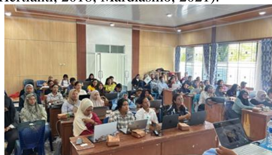
Gambar 3: Peserta sedang Pelatihan

Pelaksanaan kegiatan difokuskan pada penguatan pemahaman akuntansi dasar dan praktik pencatatan berbasis aplikasi. Materi yang diberikan meliputi laporan keuangan dan kebijakan akuntansi, persamaan dasar akuntansi, pengenalan akun akuntansi, teknik analisis transaksi, pengenalan aplikasi PPAK BUMDes, simulasi jurnal umum ke aplikasi, praktik penyusunan jurnal umum dari Buku Kas Umum, SOP pengadaan barang/jasa BUMNagori, teknik pengarsipan bukti transaksi, landasan hukum musyawarah nagori laporan tahunan BUMNagori, serta kebijakan pembagian laba usaha atau kerugian usaha BUMNagori. Materi tersebut relevan dengan kebutuhan tata kelola keuangan BUMNagori karena pengelolaan keuangan yang baik membutuhkan kemampuan mencatat, mengklasifikasi, menyajikan, dan mempertanggungjawabkan transaksi secara tertib (Nordian & Hertianti, 2018; Mardiasmo, 2021).