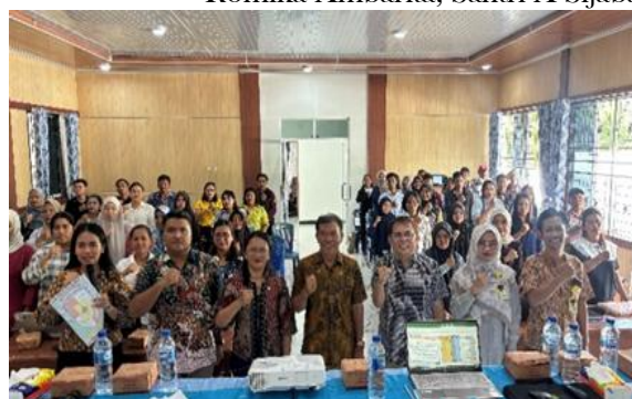
Gambar 2: Foto bersama Narasumber, Tim DPMN Kabupaten Simalungun dan Camat Tanah Jawa

Kegiatan pendampingan penyusunan laporan keuangan BUMNagori melalui aplikasi PPAK BUMDes di Kantor Camat Tanah Jawa dilaksanakan sebagai upaya meningkatkan kapasitas peserta dalam memahami, mencatat, mengelola, dan melaporkan transaksi keuangan secara lebih tertib. Kegiatan ini diikuti oleh 51 orang bendahara dan pengelola BUMNagori dari Kecamatan Tanah Jawa, Huta Bayu Raja, Jawa Maraja Bah Jambi, dan Hatonduhan.