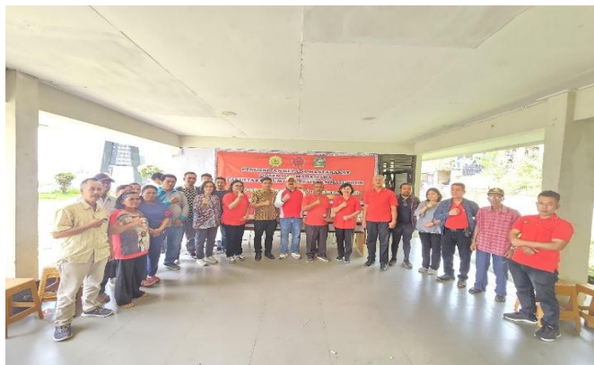
Gambar 4: Dokumentasi Kegiatan