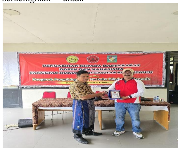
Gambar 3: Dokumentasi Kegiatan

Dokumentasi terkait kegiatan ini dapat dilihat pada Gambar 1, dan 2.