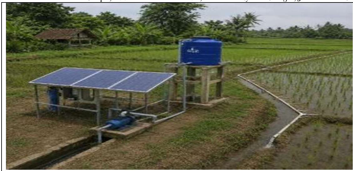
Gambar 3: Desain pompa dalam memenuhi kebutuhan irigasi