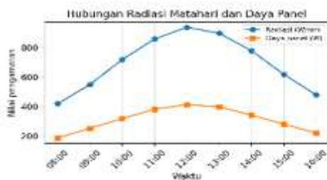
Gambar 2: Pola hubungan radiasi matahari dan daya panel terhadap waktu.

Pada kegiatan pengabdian, grafik ini digunakan sebagai media penjelasan kepada petani. Petani dapat memahami bahwa pompa tenaga surya tidak bekerja dengan keluaran yang sama sepanjang hari. Kinerja terbaik terjadi ketika matahari cukup kuat dan panel tidak tertutup bayangan. Karena itu, penempatan panel dan pembersihan permukaan panel menjadi bagian penting dari perawatan harian.