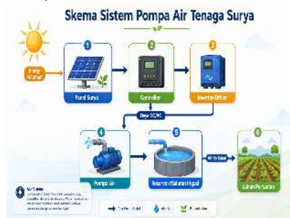
Gambar 1: Skema sistem pompa air tenaga surya off-grid untuk irigasi pertanian skala kecil.

Gambar 1 memperlihatkan alur kerja sistem pompa air tenaga surya. Panel surya menerima radiasi matahari dan menghasilkan arus listrik. Daya listrik tersebut diatur oleh controller dan diteruskan ke driver atau inverter untuk menggerakkan pompa. Pompa kemudian mengalirkan air dari sumber menuju reservoir atau saluran irigasi. Prinsip ini relatif sederhana sehingga cocok diperkenalkan sebagai teknologi tepat guna untuk petani.