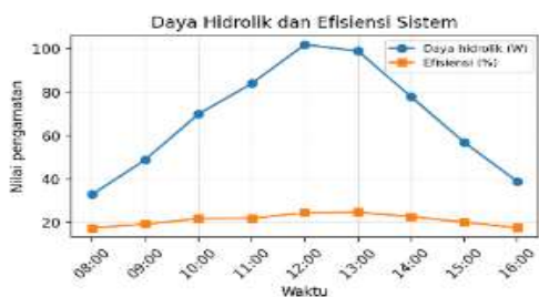
Gambar 4: Daya hidrolik dan efisiensi sistem terhadap waktu.

Efisiensi total sistem dipengaruhi oleh beberapa faktor, antara lain efisiensi panel, losses pada kabel dan controller, efisiensi motor pompa, kondisi pipa, serta head aktual. Efisiensi yang diperoleh dalam kegiatan ini masih tergolong wajar untuk sistem skala kecil sederhana. Peningkatan efisiensi dapat dilakukan melalui pemilihan pompa yang lebih sesuai dengan karakteristik panel, pengurangan panjang pipa yang tidak perlu, penggunaan kabel dengan ukuran yang memadai, serta penempatan panel pada posisi yang tepat.