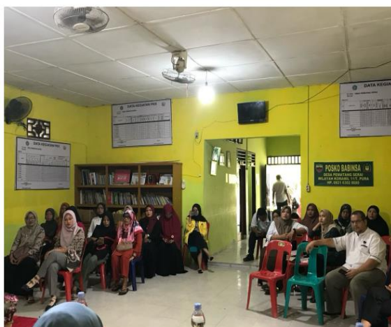
Gambar 2: Pelaksanaan Pengabdian Kepada Masyarakat