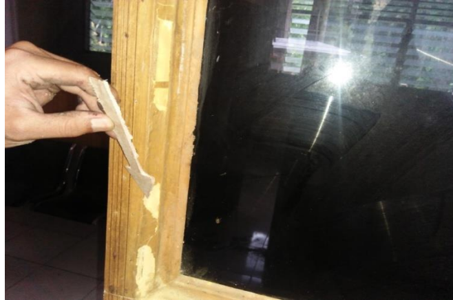
Gambar 9. Salah satu contoh bagian bangunan yang rusak akibat serangan rayap

Bangunan merupakan wujud fisik hasil pekerjaan konstruksi yang menyatu dengan kedudukannya dan berfungsi sebagai tempat manusia melakukan berbagai aktifitas. Keberadaan suatu bangunan tidak dapat terpisahkan dari berbagai faktor lingkungan yang berada di sekitar tapak bangunan baik di dalam maupun di luar bangunan gedung. Faktor tersebut berinteraksi dan memberikan beragam pengaruh termasuk ketahanan bangunan gedung itu sendiri. Interaksi yang terjadi menyebabkan ketahanan bangunan terganggu dari waktu ke waktu kualitas ketahanannya menjadi semakin menurun. Penurunan ketahanan bangunan tentunya akan mengakibatkan seluruh totalitas fungsional bangunan yang mempunyai nilai keamanan, kenyamanan, kesehatan, keharmonisan lingkungan terganggu sehingga memberikan dampak pada nilai materil maupun nonmateril khususnya yang terkait dengan masalah keamanan dan ketentraman pemakaian bangunan.