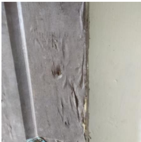
Gambar 4 . Kerusakan pada kusen pintu yang terdapat di ruang Perpustakaan

Buku-buku dipergustakaan memiliki kandungan selulosa yang merupakan makanan utama rayap. Hal ini sesuai dengan pernyataan Nandika (2003), rayap merupakan serangga pemakan kayu yang memiliki komponen selulosa di dalamnya. Makanan utama rayap selain selulosa kayu, juga selulosa yang terdapat pada sabut kelapa, rumput, kertas, karton, tekstil dan kulit-kulit tanaman.