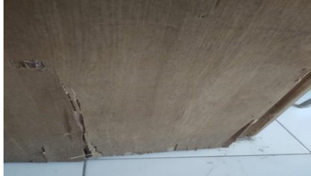
Gambar 5. Kerusakan pada daun pintu akibat serangan rayap yang terdapat di ruang Wakil Dekan II FP-USI

Intensitas kerusakannya masuk dalam kategori berat dengan jumlah kerusakan sebanyak 8 pintu (lihat Lampiran 1).