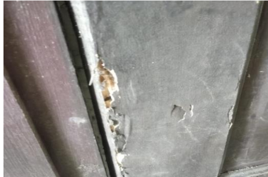
Gambar 3. Kerusakan pada kusen jendela yang berada di ruang kuliah

dan retak. Hal ini diakibatkan oleh pemakaian jenis kayu berkelas awet rendah sehingga mudah terserang rayap. Disamping itu kerusakan ini dapat disebabkan kurang adanya perawatan secara berkala terhadap kusen. Bentuk kerusakan pada kusen jendela dapat dilihat pada Gambar 3.