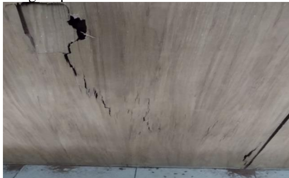
Gambar 6. Kerusakan pada dinding triplek akibat serangan rayap yang terdapat di ruang Wakil Dekan III FP-USI

sebesar 25,70% dan intensitas kerusakan termasuk dalam kondisi serangan berat.