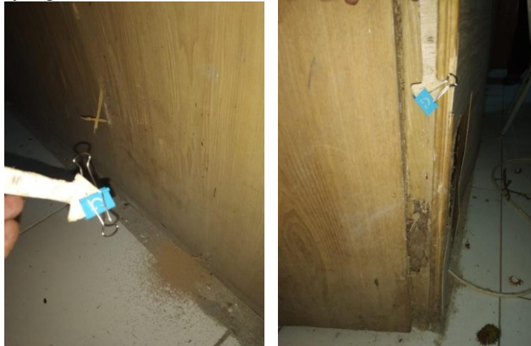
Gambar 8. Kumpulan frass di lantai sebagai akibat dari serangan rayap Cryptotermes , spp

kayu yang tidak awet atau diawetkan) dan (2) obyek sasaran terserang oleh rayap yang berasal dari obyek lain yang telah diserang dan letaknya berdekatan (Nandika, 2003).