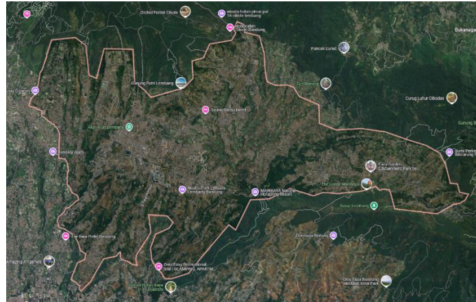
Gambar 1. Area Penelitian

hanya berfungsi sebagai tempat peristirahatan, tetapi juga sebagai alternatif akomodasi yang menawarkan pengalaman berbeda bagi wisatawan yang ingin menikmati suasana tenang jauh dari hiruk-pikuk kehidupan perkotaan. Dalam konteks ini, penting bagi perencanaan wilayah untuk beradaptasi dengan perubahan permintaan tersebut, sehingga pengembangan vila dapat dilakukan secara berkelanjutan dan terintegrasi dengan rencana tata ruang yang ada.